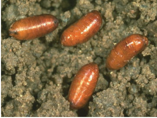
صورة عدد 5: شرنق الذبابة المتوسطة للفواكه.