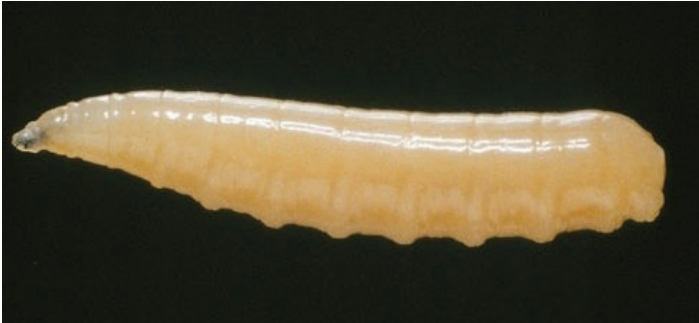
صورة عدد 4: يرقة الذبابة المتوسطة للفواكه.

* الطور اليرقي: تعرف هذه الحشرة بثلاث أطوار يرقية حيث تحمل اليرقة لون أبيض مصفر و شكل اسطواني و مدببة من الأمام إلى جانب أنها عديمة الأرجل (صورة عدد 4)