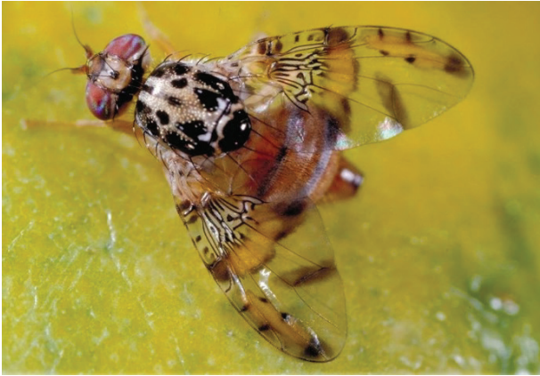
صورة عدد 1: الذبابة المتوسطة للفواكه

تعتبر الذبابة المتوسطة للفواكه أو ما يعرف بحشرة "السيراتيت" من الآفات الحشرية الأكثر خطورة في العالم نظرا للخسائر الاقتصادية التي تسببها على العديد من الزراعات البيولوجية. فمنذ ظهورها سنة 1824 بجنوب إفريقيا، انتشرت في العديد من الدول في العالم (صورة عدد 1) لنجدها بكل البلدان الإفريقية تقريبا (تونس، الجزائر، المغرب، ليبيا، أنغولا، نيجيريا، الكامرون، غينيا، غانا، مالي، ...) وبعض البلدان الآسيوية (الأردن، لبنان، السعودية، سوريا، تركيا، اليمن،...) و الأوروبية (فرنسا، إيطاليا، اسبانيا، اليونان، كرواتيا، البرتغال،...) والعديد من البلدان الأخرى (الأرجنتين، البرازيل، كولومبيا، أوروغواي، فنزويلا، كوستاريكا، السلفادور،...). فكيف يمكننا تعريف هذه الآفة التي تنخر محاصيلنا من الغلال وماهي طرق مكافحتها حسب النمط البيولوجي؟