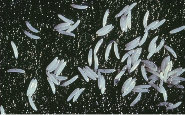
صورة عدد 3: بيض الذبابة المتوسطة للفواكه.

* الطور اليرقي: تعرف هذه الحشرة بثلاث أطوار يرقية حيث تحمل اليرقة لون أبيض مصفر و شكل اسطواني و مدببة من الأمام إلى جانب أنها عديمة الأرجل (صورة عدد 4)